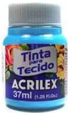
535 Azul Mar