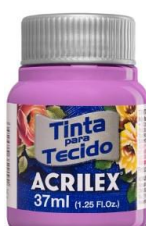
638 Flor de malva