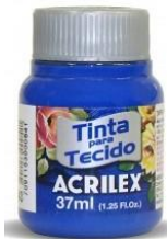
543 A. Ultramar