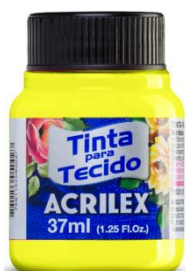
102 Amarillo Limón