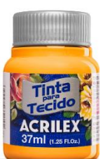
833 Amarillo Yema