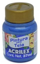
535 Azul Mar