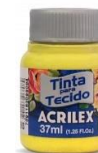
589 Amarillo Canario