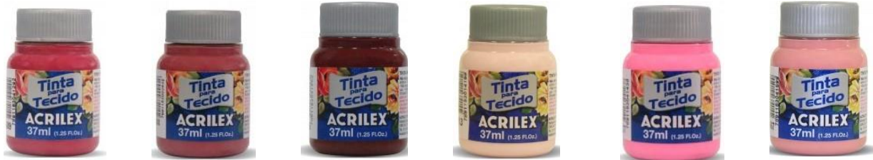
509 Rojo Carmín 588 Rojo Quemado 565 Vino 813 Rosa Bebé 537 Rosa 567 Rosa Té