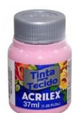
909 Tutti Frutti