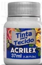
627 Gris Claro