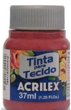
632 Rojo Profundo