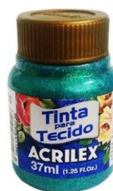
213 Verde Esmeralda