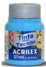
503 Azul Celeste