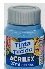
825 Azul Country