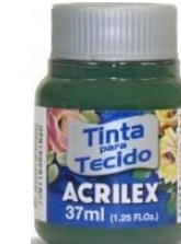
546 V. Pino