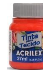
507 Rojo Fuego