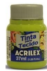
570 V. Pistacho