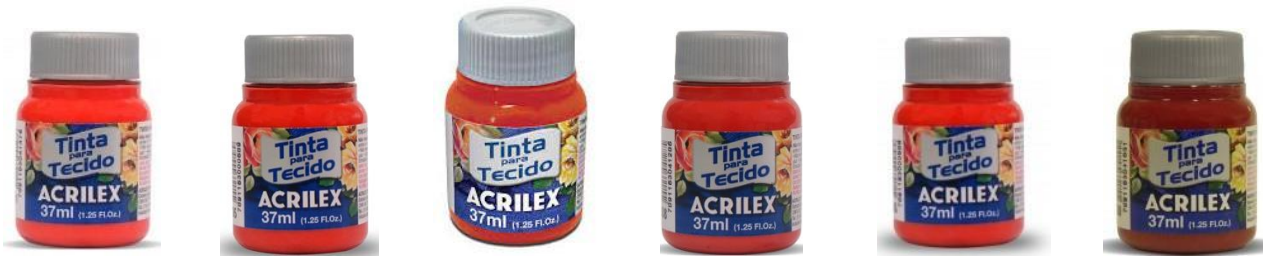
541 Rojo Vivo 984 Rojo Navidad 583 Rojo Tomate 508 Rojo Escarlata 805 Guayaba Q. 550 Púrpura