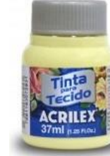
808 Amarillo Bebé