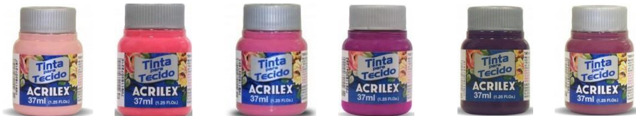
988 Rosse 527 Pink 542 Rosa Oscuro 549 Magenta 995 Uva 804 Fucsia