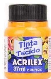
108 Amarillo Oro