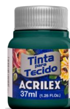
629 Gris Onix