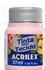
635 Rosa Candy