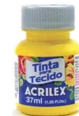
505 Amarillo Oro