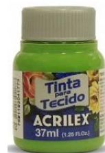
572 V. Aguacate