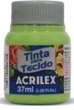
985 V. Kiwi