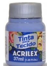
993 Azul Pizarra