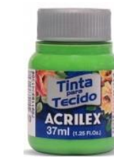
510 Verde Hoja