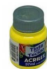
504 Amarillo Limón