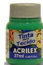
512 V. Veron s