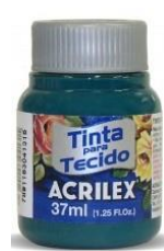
511 V. Bandera