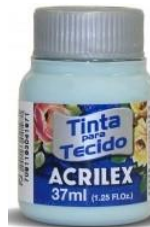
552 V. Glacial