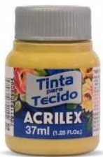
573 Ocre Oro