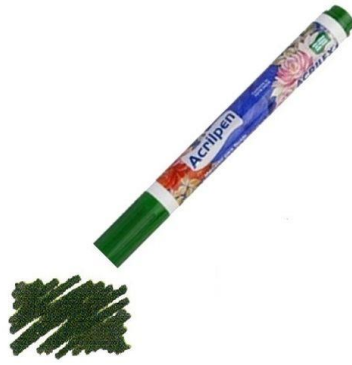
513 Verde Musgo