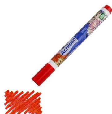
507 Rojo Fuego