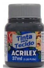
994 Gris Oscuro