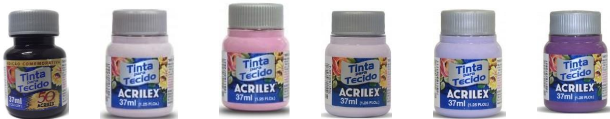
996 Berengena 587 Lavanda 581 Rosa Ciclamen 809 Lila Bebé 528 Lila 998 Mora