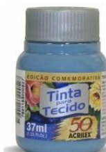
584 Azul Invierno