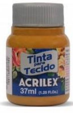
539 Siena Natural