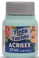
810 V. Beb 