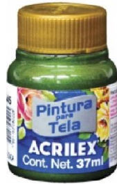
545 Verde Oliva