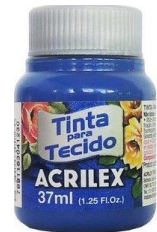
502 Azul Cobalto