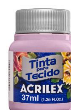
636 Rosa Inglesa