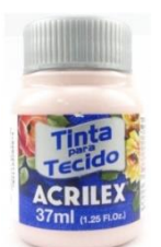
634 Cara Muñeca