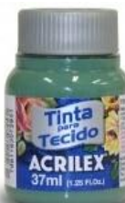
594 V. Seco