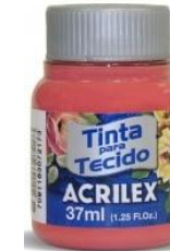
800 Rojo Bebé