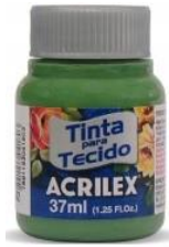
582 V. Grama