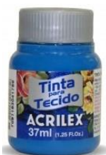
568 Azul Ceruelo