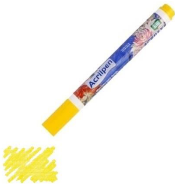
505 Amarillo Oro