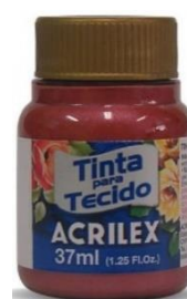
507 Rojo Fuego