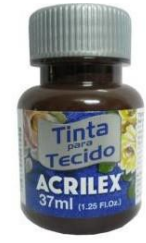
514 Tierra Quemada