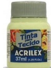
897 Verde Soft