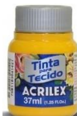
536 Amarillo Cadmio