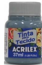
574 Gris Lunar