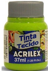
802 V. Manzana