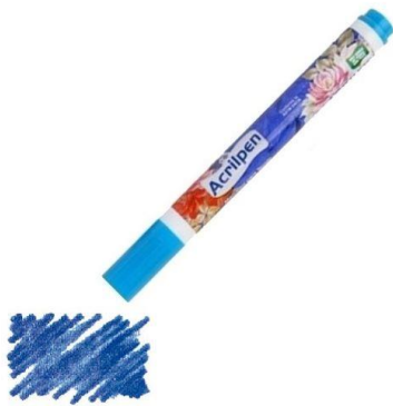
503 Azul Celeste