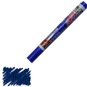
501 Azul Turquesa