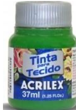
513 V. Musgo