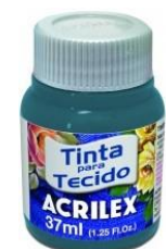
803 Aqua Marina