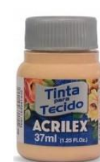
538 AMARILLO PIEL