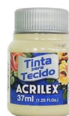
926 V. Musgo Claro