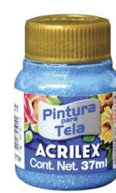
211 Azul Turquesa