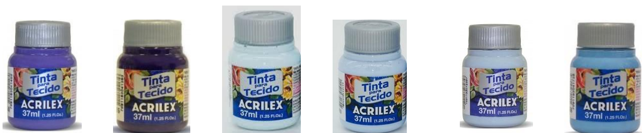
540 Violeta Cobalto 516 Violeta 992 Azul Soft 811 Azul Bebé 579 Aul Hortensia 560 Azul Caribe