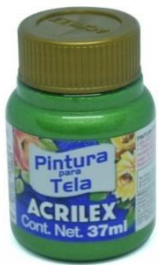
513 Verde Musgo