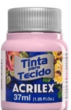
633 Lila seco