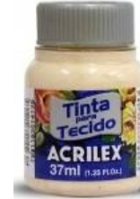
812 Salmón Bebé