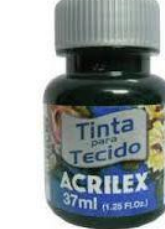
860 V. Pantano