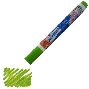
510 Verde Hoja