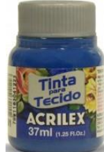
501 A. Turquesa